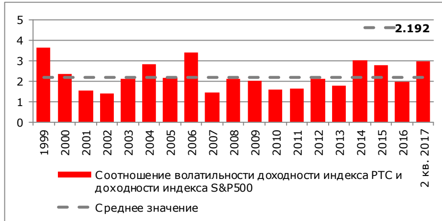
Рисунок 1. Соотношение стандартного отклонения доходности индекса PTC и стандартного отклонения доходности индекса S&P500