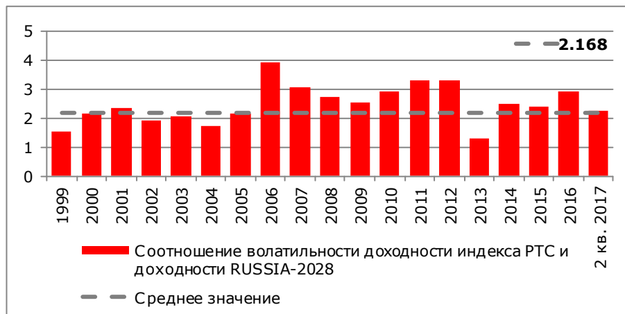
Рисунок 2. Соотношение стандартного отклонения доходности индекса PTC и стандартного отклонения доходности RUSSIA-2028